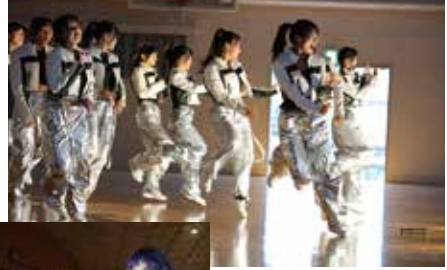
舞台発表、展示など 充実した内容です。