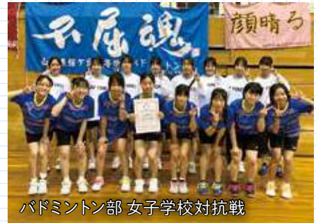
バドミントン部 女子学校対抗戦