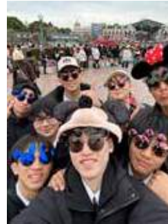
2年次に3泊4日の 修学旅行。 貴重な体験と なります。