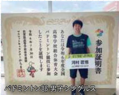
バドミントン部 男子シングルス