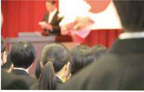
希望に満ちた「桜ヶ丘ライフ」がスタート。