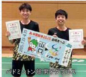
バドミントン部 男子ダブルス