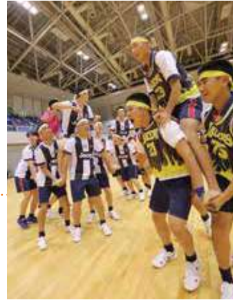
アリーナを 借り切って 冷暖房完備の 環境で競技も 応援も白熱。