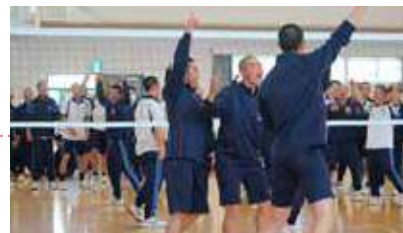
クラス対抗で競い合います。迫力満点です。