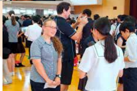
姉妹校の「キャセドラル学園（オーストラリア タウンズビル市）」の生徒が来校し、交流します。