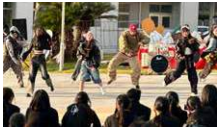
アーティスト系の生徒が歌やダンスなどの 成果を発表します。