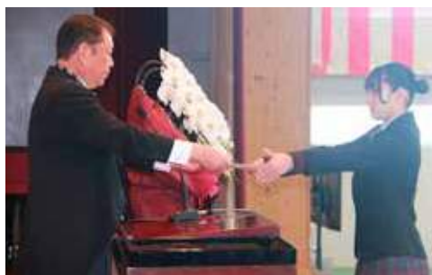
桜ヶ丘での学びを胸にそれぞれの未来へ。