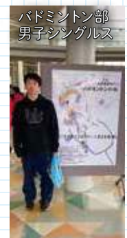
バドミントン部 男子シングルス